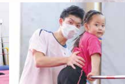
あした天気になあれ ※写真はイメージです。内容は裏面をご覧ください。